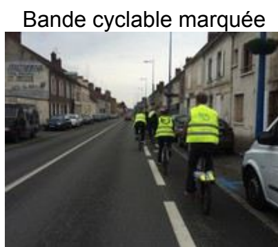
Bande cyclable marquée