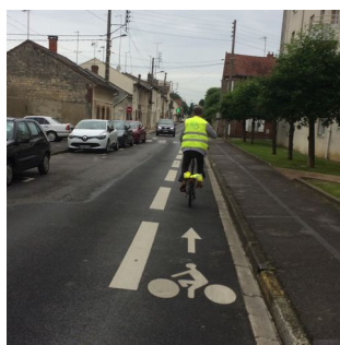
Bande Cyclable marquée + pictogramme vélo

Exemples d'aménagements cyclables (Pont Sainte Maxence 2016 et autres)