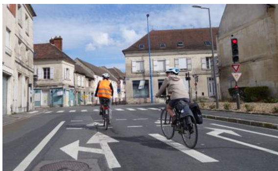
SAS Vélo au feu, équipé d'un cédez le passage cycliste